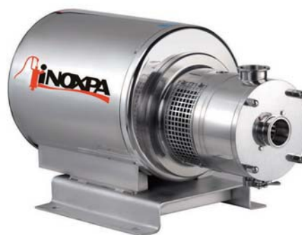
ME 4100 поточный миксер