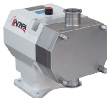
HLR кулачковый насос